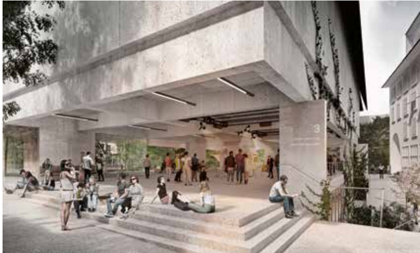
Die Jury empfahl das Projekt von Architecture Club aus Basel zur Weiterbearbeitung. Der Neubau mit der Salle Modulable schwebt über dem Freiraum und bildet ein Aussenfoyer.