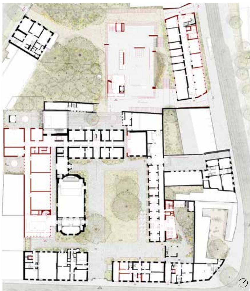
Ein prägnanter Neubau besetzt den Nordhof im Projekt von Architecture Club aus Basel. Die anderen Bauten werden sanft saniert und erweitert. Mst. 1:200.